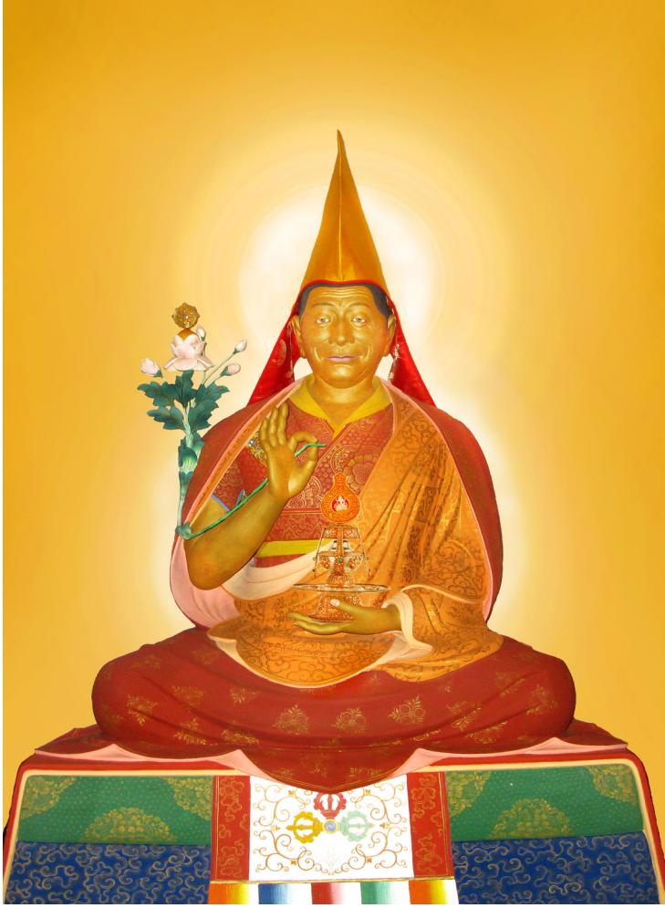
༄༅། སྐུབས་རྗེ་དགེ་བཤེས་རབ་བརྟན་རིན་པོ་ཆེ། Kjabdže Geše Rabten Rinpoče